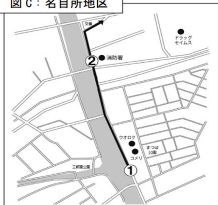
図 C : 名目所地区